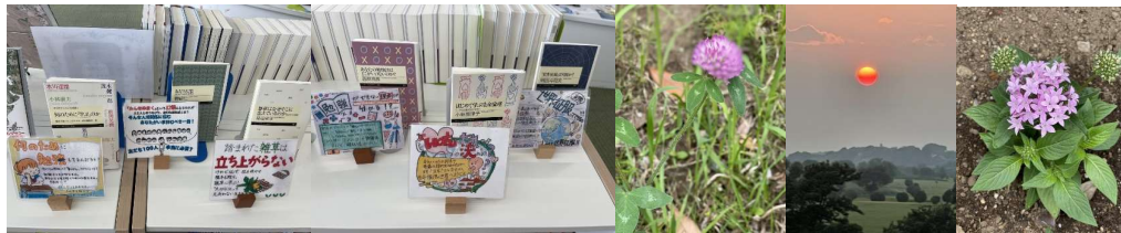
写真は、バス停の草花(6月17日撮影)・「梅雨の間に真丸夕陽落ちてくる」(17日)・花壇の花(20日)