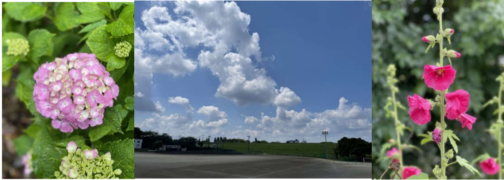
*写真左から 6日梅雨入り、通用門の紫陽の花(6月6日撮影) 6月の青い空・バス停の立葵(4日)