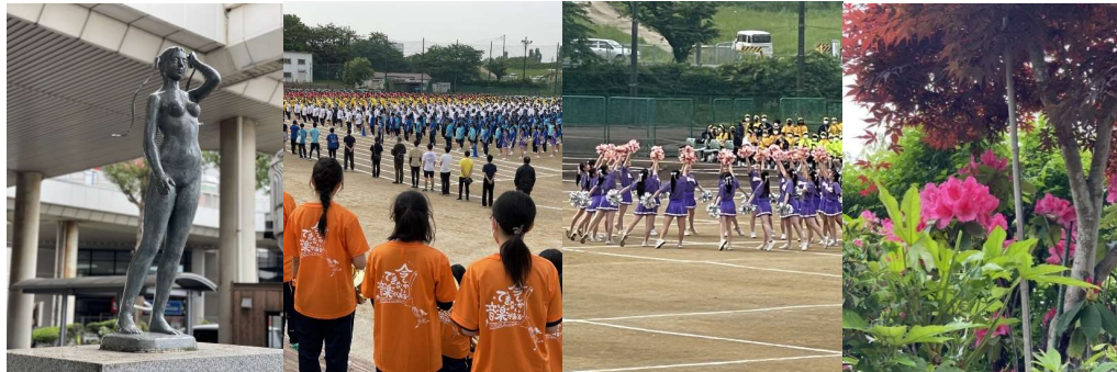
* 写真左から・取手駅西口バス・ロータリー工事のため撤去中のトラックの上に乗る少女像「和なごみ」平塚正義作(5月17日撮影)・3年ぶりの体育祭(20日撮影)・ブーゲンビリアは夏の花(12日撮影)