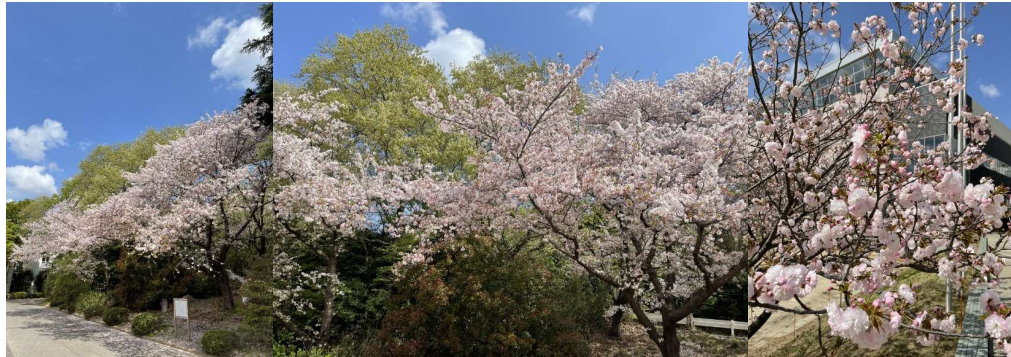
* 写真左・中は通用門右側の淡いピンクのソメイヨシノ、右は Sakura Arena 手前のピンクの八重桜です(4月3日撮影)。満開は小さなつぼみから、ひらきます。「このつぼみ笑うがごとく花ひらけ (司書)」

「春は曙 やうやう白く成り行く 山ぎはすこし明りて 紫だちたる雲の 細くたなびきたる」清少納言『枕草子』